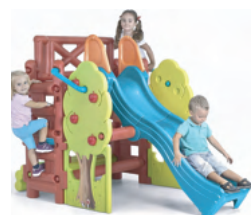
Scivolo da interno